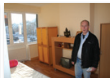
Inhoudiging van onze solidaire woningen, in aanwezigheid van de pers en de verantwoordelijken van de sector sociale hulp en huisvesting.